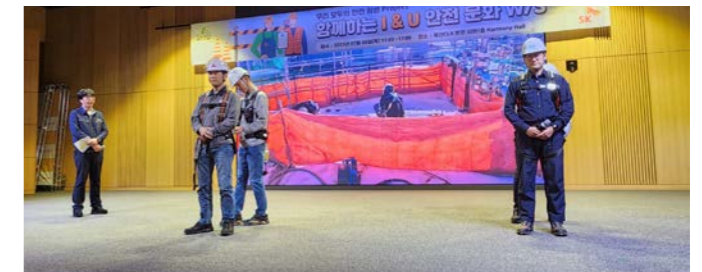
SK이노베이션 울산Complex, 협력사 구성원이 참여하는 안전문화 워크숍 개최

SK이노베이션은 산업안전보건법에 의거하여 SHE 업무 담당자와 구성원 관리감독자를 대상으로 연 16시간 이상의 안전보건교육을 실시합니다. 사업장의 생산직과 사무직 근로자를 대상으로는 매분기 6시간 이상(연간 24시간) 정기 안전보건교육을 시행하여 법규보다 강화된 교육을 실시하고 있으며, 신규 채용자를 대상으로 8시간 이상 법정 산업안전보건교육을 시행하고 있습니다. 안전보건교육은 관리감독자 정기 안전보건교육, 채용 시 안전보건교육, 작업 내용 변경 시 안전보건교육, 공정 보수작업 전 안전교육, 협력사 안전보건 교육 등으로 분류됩니다. 이와 함께 유해 또는 위험작업을 진행하는 근로자를 대상으로 16시간의 특별안전보건교육을 의무적으로 시행하고 있습니다.