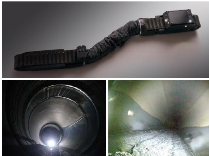
SK이노베이션 울산Complex, 배관 내부 검사 ‘Guardian-S(로봇 뱀)’