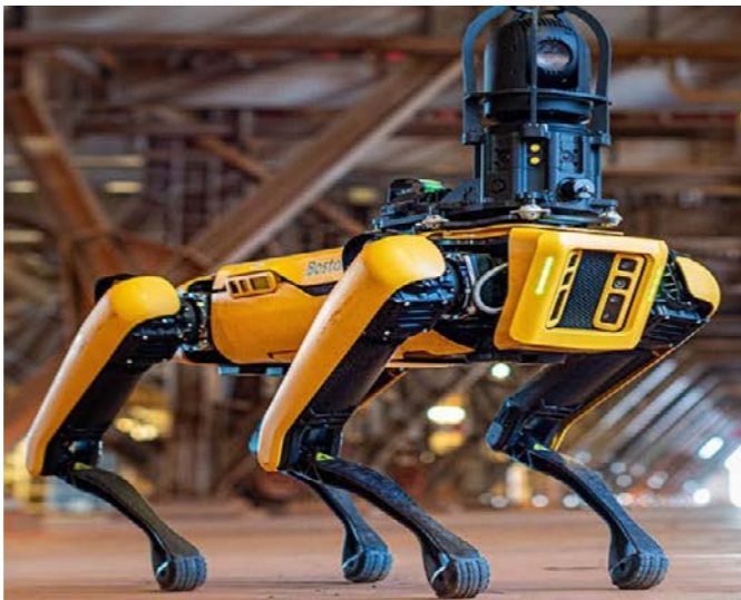
SK이노베이션 울산Complex, 안전 지킴이 ‘지능형 로봇’ 운영

SK이노베이션은 2019년부터 정유·석유화학 사업장을 중심으로 중대사고 근절을 위한 다양한 활동 과제를 도출하여 지속적으로 실행해왔습니다. 2022년에는 유증기에 의한 화재·폭발 위험 설비 개선, 화재 누출 조기 감지를 위한 시스템 적정성 검토, 화재발생 가능성이 높은 회전 기계에 대한 누출 방지 시스템 개선, Glass 설치 및 점검 기준에 따른 개선 등의 설비 투자 사업을 진행하였습니다. 이와 함께, 중대사고 발생 시 신속한 대응 및 수습 조치를 위한 체계 정립 및 관련 절차 개정 등 관리기준도 개선하였습니다. 또한, 중대사고 근절 개선 활동에 대해 연중 상시 이행성 점검을 수행하고, 안전 리더십 제고를 위한 ‘안전 리더십 행동기준 강화’ 테스크 포스를 운영하는 한편, 안전문화 정착 및 실행력 제고를 위한 노력을 지속하고 있습니다. 2023년에도 SK이노베이션은 중대사고 근절활동을 통해 사고를 예방하고 사고발생 시 피해를 최소화할 수 있도록 다방면으로 노력할 것입니다.